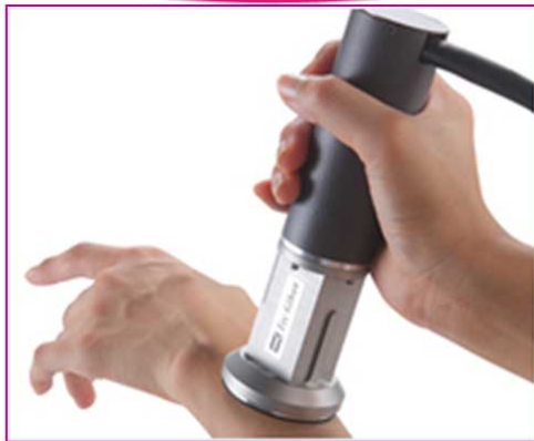
柔さ計測システム HG1001/MSES5012